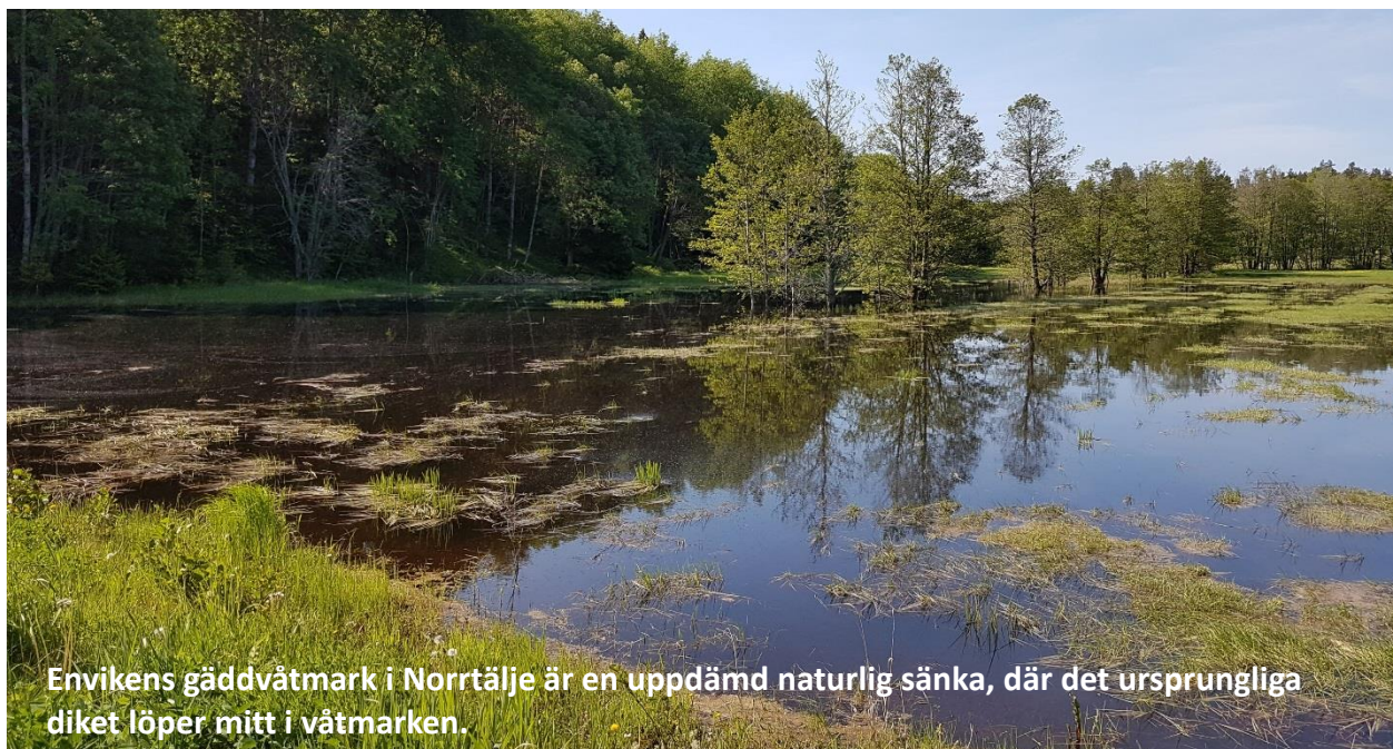
Envikens gäddvåtmark i Norrtälje är en uppdämd naturlig sänka, där det ursprungliga diket löper mitt i våtmarken.

För gäddor bör djupet i våtmarken vara mellan 30 och 50 cm. Våtmarken behöver vara uppdämd i mars-juni. Man rekommenderar att våtmarken töms totalt efter det för att kunna bedriva slåtter eller bete under torrperioden.