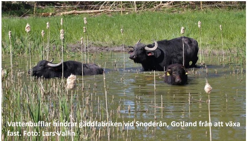
Vattenbufflar hindrar gäddfabriken vid Snoderån, Gotland från att växa fast.

Det är viktigt att kontrollera de tekniska delarna av våtmarken årligen. Kontrollera att nivåregleringen inte är igensatt. Kontrollera att vallarna och nivåregleringen är utan erosionsskador samt att det inte växer sly eller träd på vällen. Större rötter som växer i vällen kan orsaka svagheter och läckage med tiden. Kontrollera också eventuella utkiksplatser och vandringsleder. Lätta röjningsarbeten och underhåll kan öka trivselen för alla som nyttjar området.