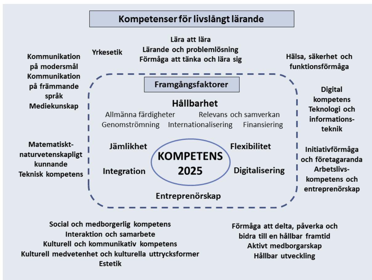
Bild 1. Framgångsfaktorer för åländsk utbildning

Den åländska utbildningen är beroende av utvecklingstendenser i ett omvärldsperspektiv. De kompetenser för livslångt lärande som individen behöver inneha i en globaliserad ekonomi är generella och gäller således på Åland liksom i vår omvärld.