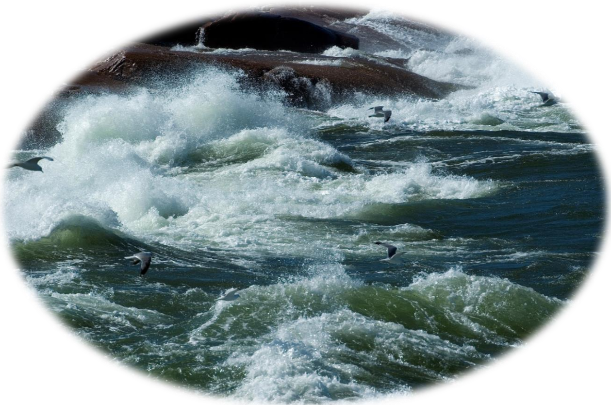
Marin miljö Åland.

tidsfrist för de kustvatten som hör till vattendirektivet beskrivs noggrannare i Förvaltningsplanens kapitel 7.13.